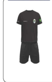
UNIFORME DE EDUCAÇÃO FÍSICA