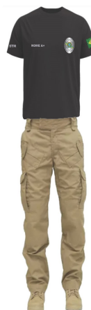
CAMISA GOLA CARECA