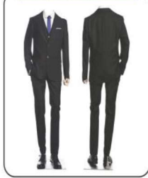
TRAJE SOCIAL MASCULINO