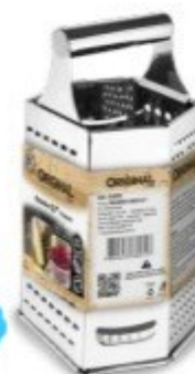
RALADOR 6 FACES 8,7" - 22 CM Ref. SL0222

EAN13: 7899751102223 CAIXA: 36/12 NCM: 8205.51.00