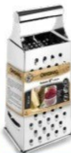
RALADOR 4 FACES 8" - 20,5 CM Ref. SL0221

EAN13: 7899653780703 CAIXA: 36/12 NCM: 8205.51.00