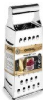
RALADOR 4 FACES 9,5" - 24 CM Ref. SL0220

EAN13: 7899653780789 CAIXA: 36/12 NCM: 8205.51.00