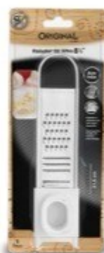
RALADOR DE ALHO 8" - 20,5 CM Ref. SL0229